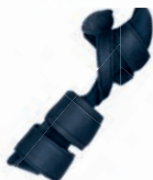
MANU-HiT® DIGITUS POLLEX